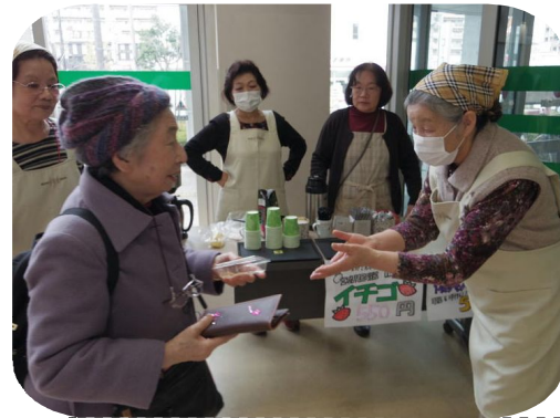
ボランティアさんたちが大活躍