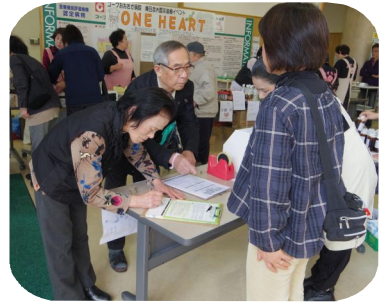
反原発の署名活動も