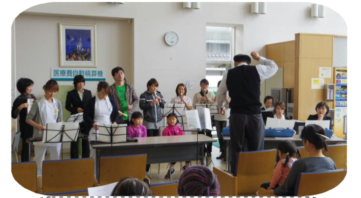
看護学生や職員の家族も合奏に参加

この日の収益金はすべて義援金にし、お預けいただいた募金とともに被災者へ届けます。みなさまのご支援ありがとうございました。被災地の復興を願って、これからも、わたしたちは支援を続けていきます。