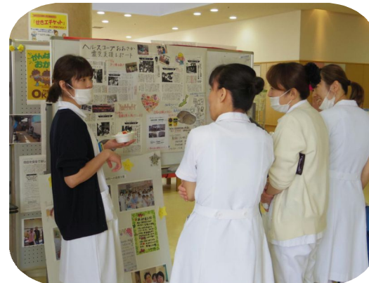
看護支援に行ったときの話を同僚に