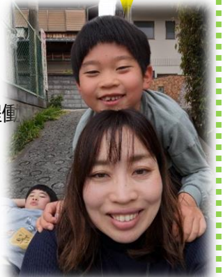
↑横でふてくされてるのが長男です。

私生活では2年・5年生男の子の母をしています。パワフルな二人に負けじと日々格闘しています。前職は歯科衛生士として15年程働きました。これからはオーラルフレイルについて勉強し、組合員さんと一緒にオーラルフレイルを取り組んでいきたいと思っています。まだまだ知らないことだらけですが、地域の組合員さんと一緒に町づくりし、私自身成長していきたいです。今は本部3階にデスクがありますので気軽にお越しください。