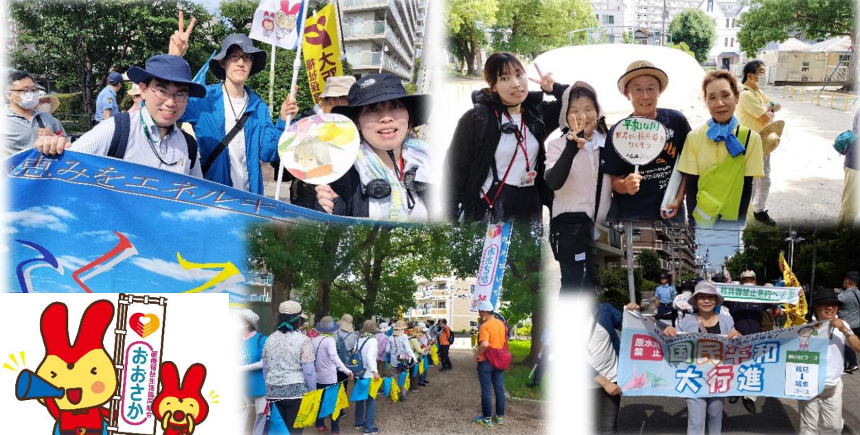
ウクライナカラーの平和の願い旗